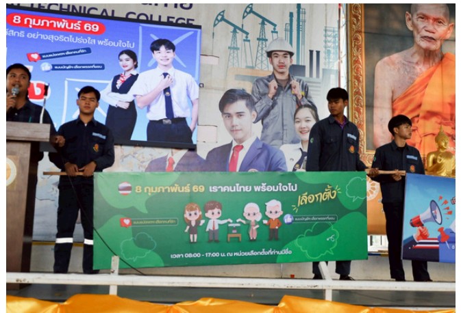
การสนับสนุนการไปใช้สิทธิเลือกตั้งและการลงประชามติ