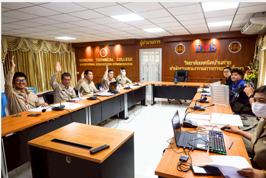
การเข้าร่วมประชุมพิจารณาในการจัดซื้อจัดจ้างตามโครงการต่างๆ