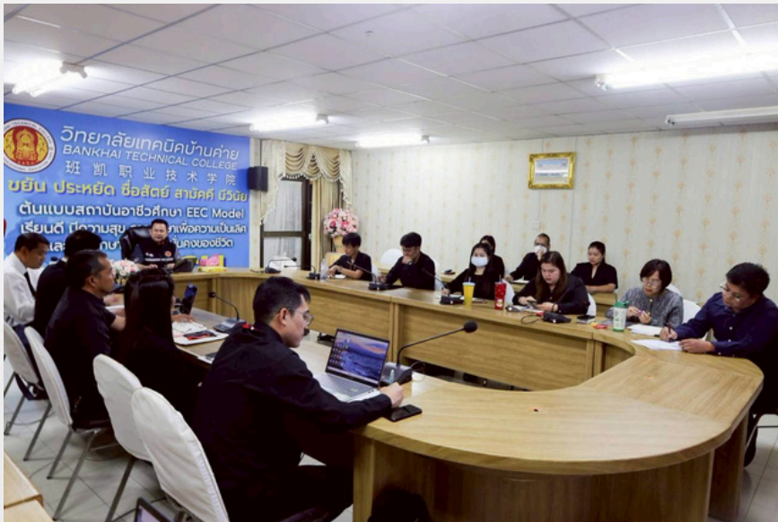
การเข้าร่วมประชุมพิจารณาหามติในที่ประชุม

๖.๕ การปกป้อง ปกป้องกันมิให้ผู้ร่วมวิชาชีพประพฤติปฏิบัติในทางที่จะเกิดภาพลักษณ์เชิงลบต่อวิชาชีพ