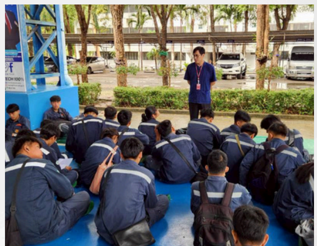
กิจกรรม Home room ประจำทุกสัปดาห์