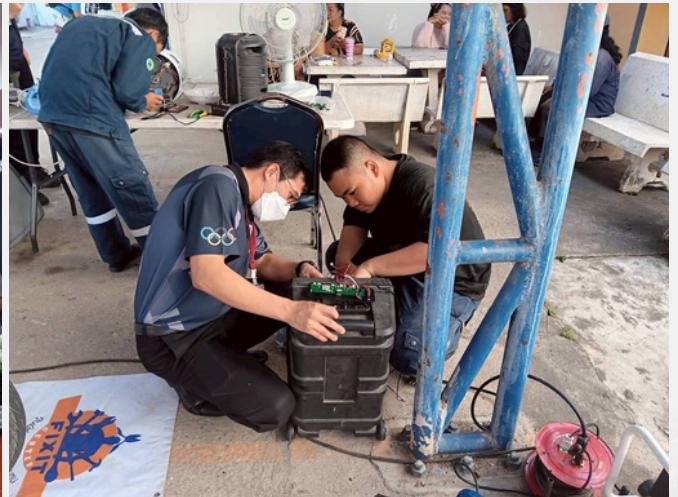
การออกบริการซ่อมเครื่องใช้ไฟฟ้าให้กับชุมชน