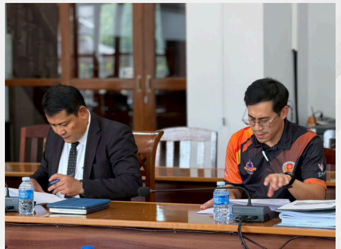
เป็นคณะกรรมการดำเนินงานการสร้างหอสมุดของวัดละหารไร่ ด้วยจิตอาสา