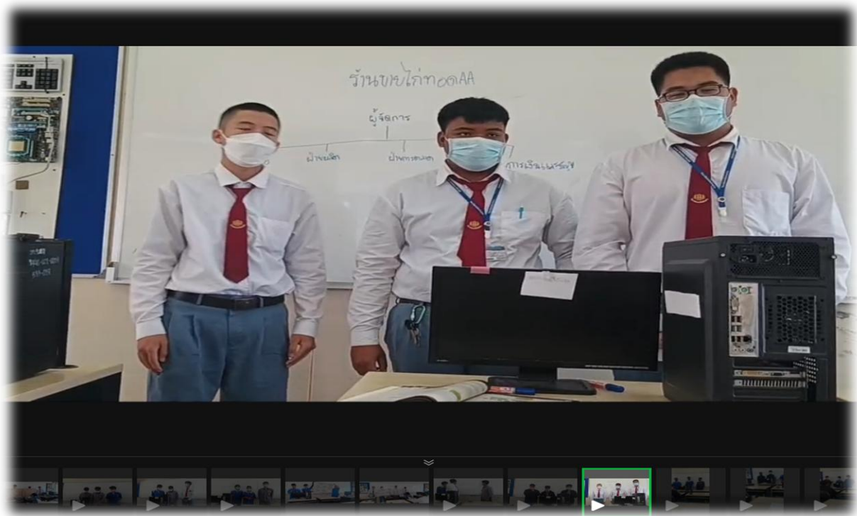
(วิดีโอ นำเสนองานโครงสร้างธุรกิจร้านไก่ทอด AA)